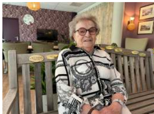
Van harte gefeliciteerd!

Mevrouw Hoolwerf werd onlangs 90 jaar! Zo bijzonder en wat een immense schat aan levenservaring. Bij De Palatijn komt er in dat geval een nieuw naamplaatje bij op het 90-jarigen-bankje.